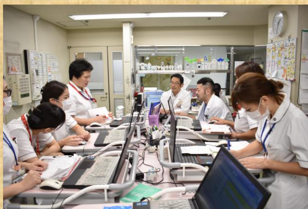
病棟カンファレンス